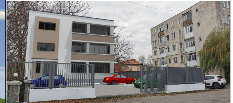
Proiectant arhitectura:-arh.Ioana Sinca